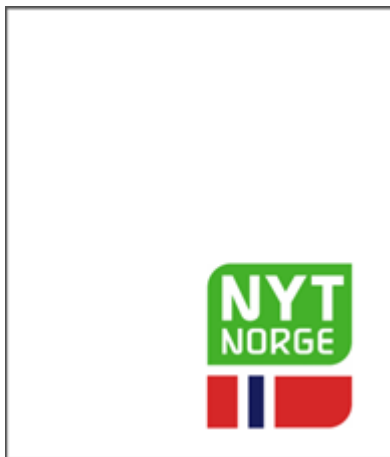
75 x 87mm «Nyt Norge» (Økonomi kvalitet)